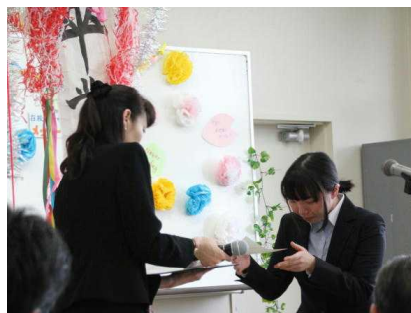
卒業生を送る集い