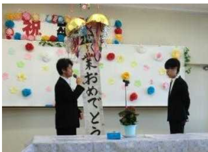
卒業生を送る集い