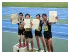
陸上部 (全国定時制通信制 陸上大会4×100mリレー全国3位)

◇ 部活動には、卓球、バドミントン、陸上、テニス、バスケットボール、書道、社会科クラブ、文芸サークル、ハイキング同好会などがあり、スクーリング日の放課後等に活動しています。