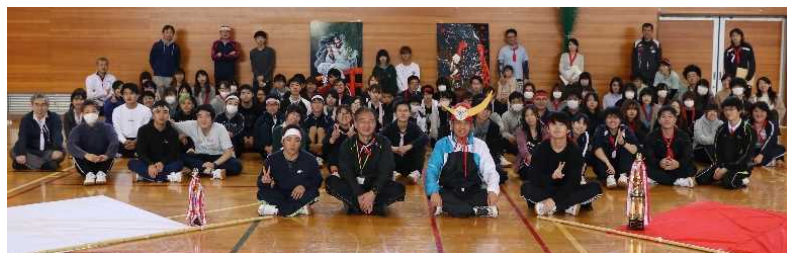
[健康管理講座(体育祭)]