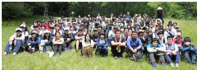
[地域歴史・地理探究(遠足)]