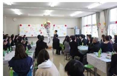
[卒業生を送る集い]