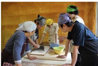
[地域文化探究(体験学習)]

色々な年齢の人がいて、同年代から聞くアドバイスとは違ったアドバイスも聞け、先生たちにも話しかけやすい学校です。全日制とは違い、厳しい校則がなく、勉強もスクーリング以外は自学自習なので自分のペースで出来るし、自由な時間がとれます。自由な分、計画性が大切だと思います。私自身も計画性が身についたと思います。単位が取れなかったといって諦めず、根気よく続けることも大切だと思います。やる気次第で大きく違うと思います。3年間で卒業もできます。やる気のある方はぜひ仲間になりましょう。(2年次生)